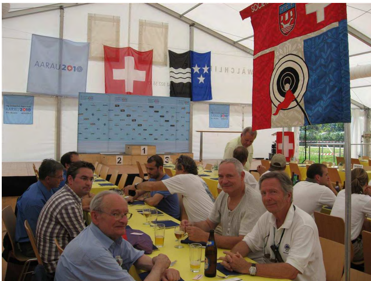
Aarau en 2010