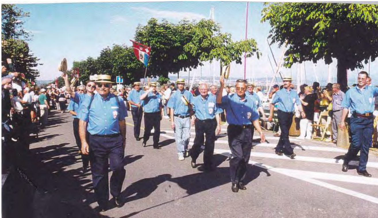
Bière en 2000

La Société Suisse de Tir de Paris participe toujours aux tirs cantonaux et fédéraux