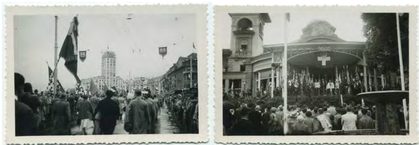
Channe 1932 de la SSTP