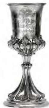
Prix obtenu au Tir fédéral de 1863 à la Chaux-de-Fonds