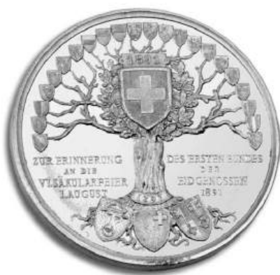
Médaille en aluminium des tireurs suisses de Paris 600 ans de la Confédération 1891

N'hésitez pas à consulter également le site http://sstp.suissemagazine.com