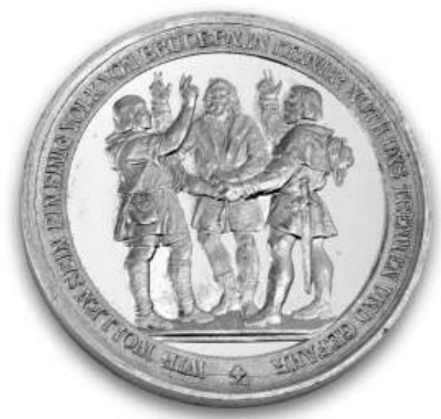
Einer für alle, alle für einen