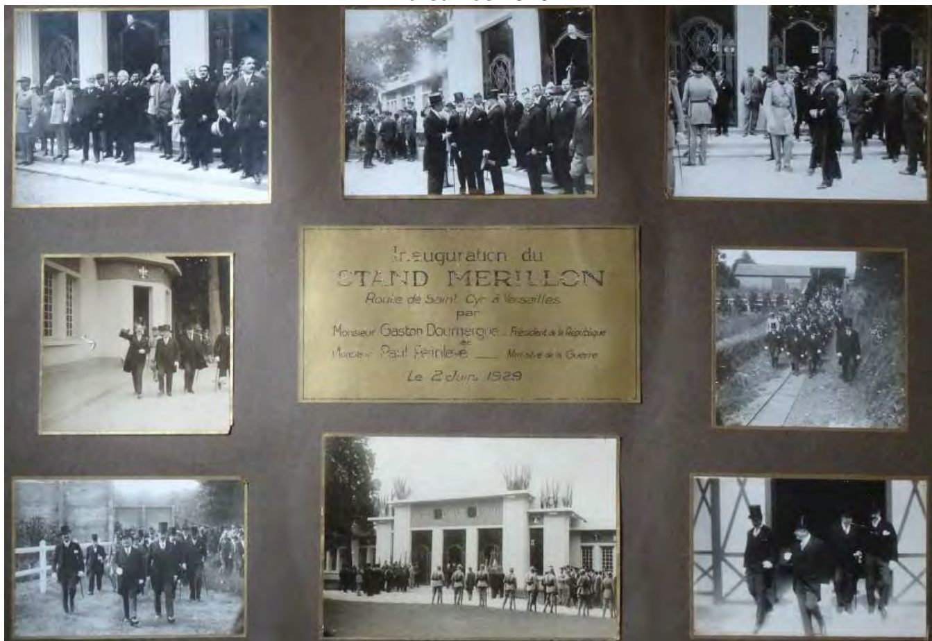
Tir Fédéral Lausanne 1954