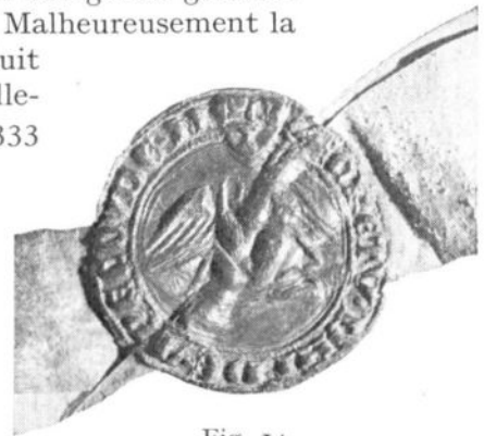
Fig. 14. Sceau de Sweder de Zuylen, 1333.

Sweder II de Zuylen, seigneur d'Abcoude et de Wijk-bij-Duurstede, chevalier, est mentionné dans les sources de 1307 à 1345 4) ; il décéda le 25 avril 1347. Plusieurs auteurs 5) assurent qu'il avait épousé Mabélie d'Arkel, tante de l'évêque d'Utrecht Jean d'Arkel (élu 1342, décédé en 1378). Mabélie († en octobre 1317?) et son mari furent inhumés à Wijk-bij-Duurstede. Leur fils Gisbert III comparaisant comme chevalier en 1338 déjà, leur mariage doit avoir eu lieu tout au commencement du XIV e siècle.